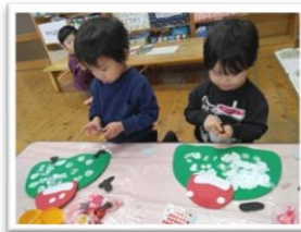
令和8年1月5日 東部保育園